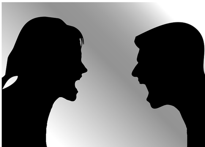
Imagen 3: Argumentando