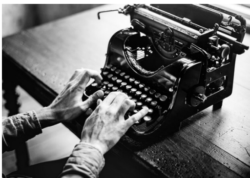
Imagen 4: Máquina de escribir Fuente: Pixabay Licencia: Creative Commons

https://pixabay.com/es/m%C3%A1quina-de-escribir-antigua-alfabeto-2242164/