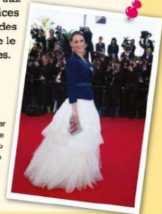
Robe créée par Alexis Mabille et portée par l'actrice Bérénice Béjo lors du Festival de Cannes 2013.

► Aujourd'hui, de nouveaux créateurs comme Vanessa Bruno, Isabelle Marant, Alexis Mabille... illustrent la mode en France. Pour eux, il est difficile de se faire connaître. Pour se faire remarquer, ils prêtent leurs vêtements aux acteurs ou actrices pour de grandes occasions comme le Festival de Cannes.