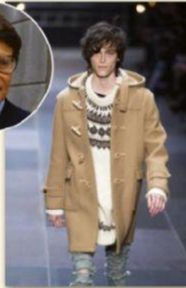
Défilé Yves Saint-Laurent.