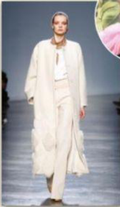
Défilé Vanessa Bruno.