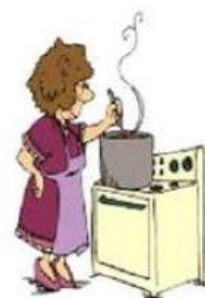
Faire la cuisine