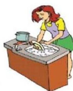
Faire la vaisselle