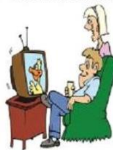
Regarder la télévision