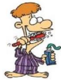
Se brosser les dents