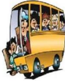
Aller à l'école