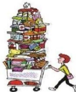
Faire des courses