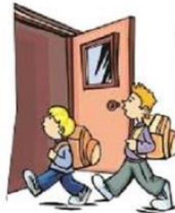
Arriver à l'école