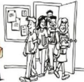
Sortir de l'école