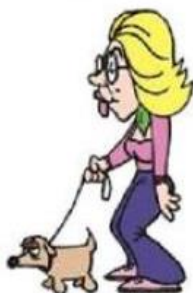
Sortir le chien