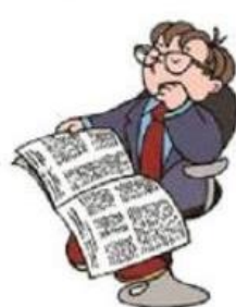
Lire le journal