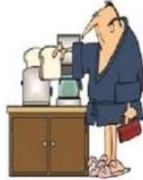
Préparer le petit Déjeuner