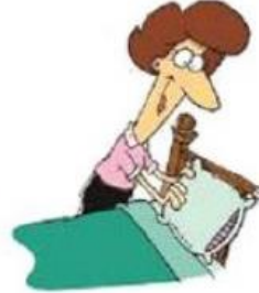
Faire le lit