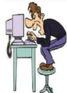
Surfer sur le web