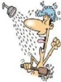
Prendre une douche