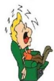
Faire une sieste