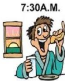
7:30A.M. Prendre le petit Déjeuner